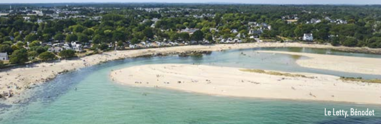
Le Letty, Bénodet