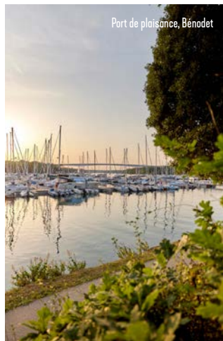
Port de plaisance, Bénodet