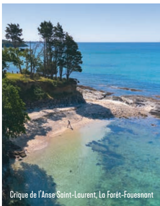
Crique de l'Anse Saint-Laurent, La Forêt-Fouesnant