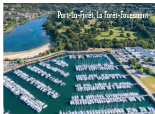
Port-La-Forêt, La Forêt-Fouesnant