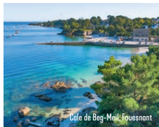
Cale de Beg-Meil, Fouesnant